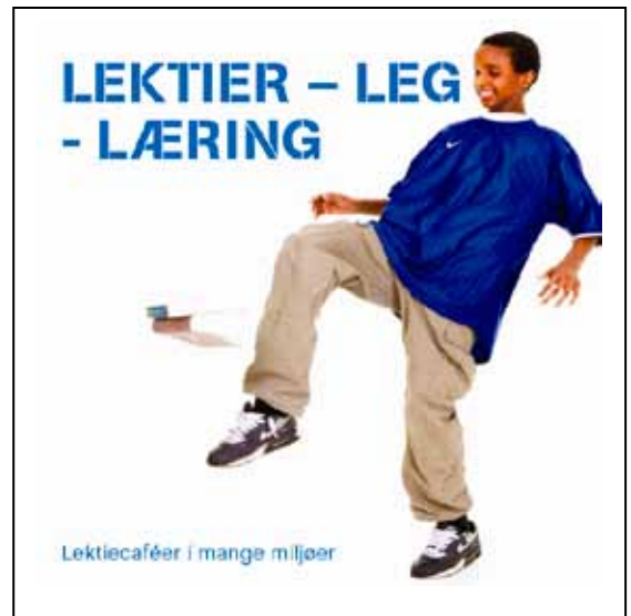
Håndbogen Lektier – Leg – Læring. Lektiecaféer i mange miljøer er resultatet af et flerårigt samarbejdsprojekt mellem Kommunernes Skolebiblioteksforening og Integrationsministeriet, Brug for alle unge.

Derfor ønskede ministeriet som led i indsatsen Brug for alle unge at indgå samarbejde med Kommunernes Skolebiblioteksforening om udgivelse af endnu et lektiecaféhæfte. Aftalen om udgivelsen blev indgået for et par år siden, men undervejs, som projektet skred frem, voksede det i omfang og måtte justeres flere gange, før det endelig udkom i januar 2011 som en egentlig håndbog i stift bind.