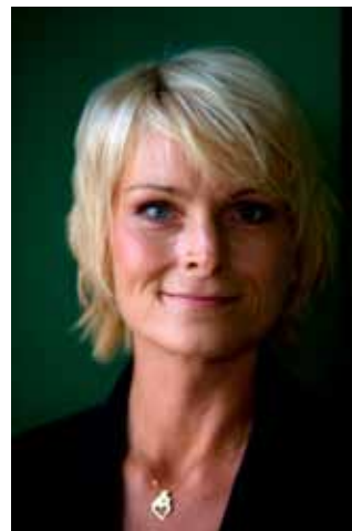
Undervisningsminister Tina Nedergaard udviste stor interesse for Kommunernes Skolebiblioteksforening, og der er allerede arrangeret et møde med hendes efterføl-

Også dette møde forløb særdeles positivt, og vi fik ud over at fortælle om foreningen og dens arbejde blandt andet mulighed for at drøfte den kommende kulturva-neundersøgelse.