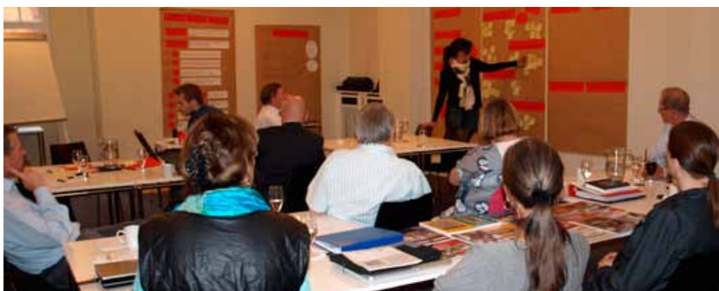
På foreningens udviklingsseminar arbejdede hovedbestyrelse, fagligt udvalg og personale samlet og i grupper på at konkretisere det kommende års arbejde og indsatsområder.

I løbet af det døgn, seminaret varede, blev der lagt en strategi og udarbejdet en handleplan for fire fokusområder, som på forhånd var foreslået af forretningsudvalget. De fire fokusområder var "Lektiecafé/rummelighed", "Kombibiblioteker/samarbejdsformer", "Skolebibliotekets dag" og "Fremtidens formidling/medier".