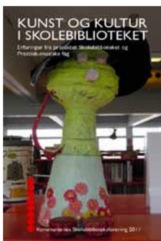
Projektet om skolebiblioteket og de praktisk-musiske fag blev afsluttet med den elektroniske publikation Kunst og kultur i skolebiblioteket .

Det drejer sig om projektet Skolebiblioteket og Naturfag , som var blevet gennemført i to faser i skoleårene 2007/2008 og 2008/2009 med støtte fra Folke- og Skolebibliotekernes Udviklingspulje, og som på