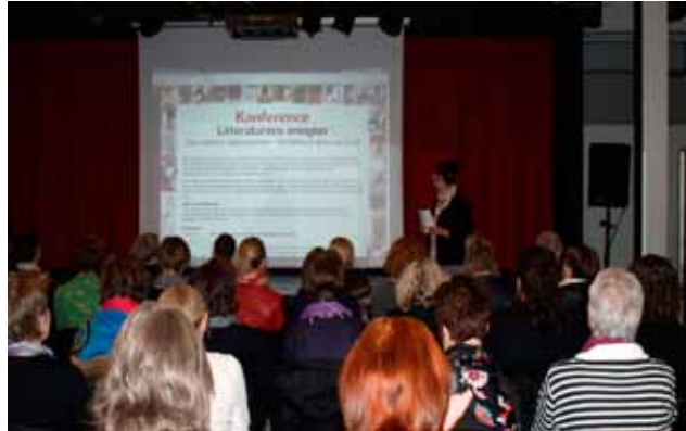
I november 2010 afholdt Kommunernes Skolebiblioteksforening den første konference i rækken om Litteraturens ansigter .

Temaet for nominering til Årets Skolebibliotek 2009/2010 , som blev præsenteret i samarbejde med hovedsponsor Dantek Biblioteksløsninger, var netværksdannelse. De tre finalister i dysten var Munkekærskolen i Solrød, Hastrupskolen i Køge og Vibenshus Skole i København. Det blev Munkekærskolen, som løb af med sejren og dermed vandt en tur til Danfoss Universe for to klasser. De to øvrige skoler modtog