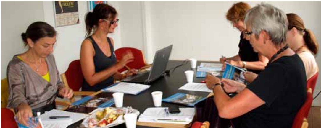
Det faglige udvalg er uundværligt for foreningens arbejde.