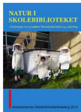
Publikationen Natur i skolebiblioteket afsluttede projektet om skolebiblioteket og naturfag.

Et andet projekt, som blev afsluttet i dette foreningsår, var projektet Skolebiblioteket og de praktisk-musiske fag . Dette var blevet gennemført i skoleåret 2009/2010 ligeledes med tilskud fra Folke- og Skolebibliotekernes Udviklingspulje. I forbindelse med afslutningen af dette projekt, blev der først på året 2011 udarbejdet en elektronisk publikation, som ligesom de øvrige foldere kan downloades fra foreningens hjemmeside.